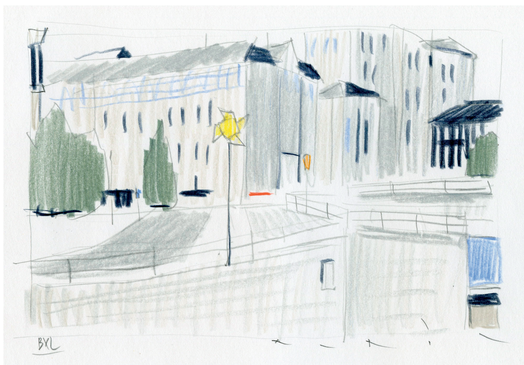
BXL 3b - Dessin préparatoire - Crayons de couleur sur papier - 2024

À cette occasion SKIRA, en coédition avec la galerie Huberty & Breyne, consacre un ouvrage rassemblant une centaine de toiles réalisées par l'artiste au cours de ces 12 dernières années.