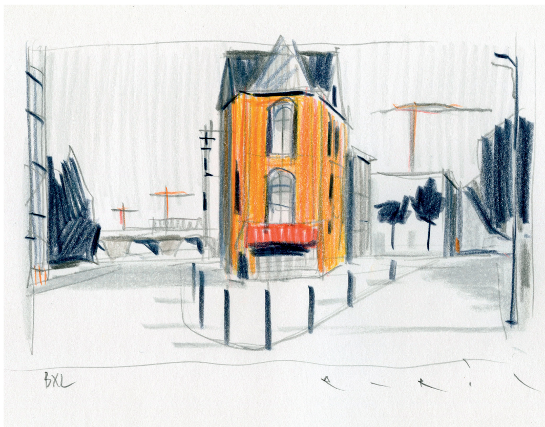
BXL 10 - Dessin préparatoire - Crayons de couleur sur papier - 2024